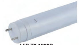
LED-T8-1200B uss 5.90