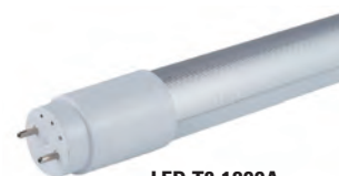
LED-T8-1200A uss 7.50