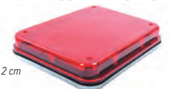
X-LTE-515-R Dimensiones: 24 x 18.2 cm

Luz de advertencia de 8x6" color rojo, con luz de trabajo color claro.