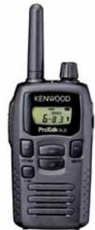
Dim: 52 x 103.5 x 29.6 mm