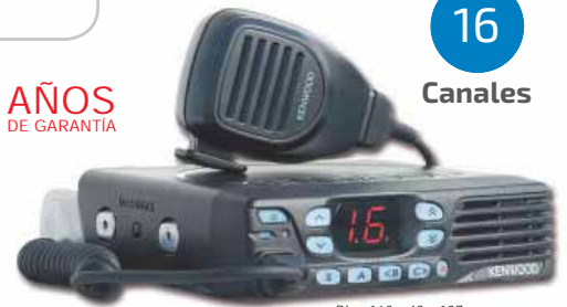
Dim: 160 x 43 x 137 mm