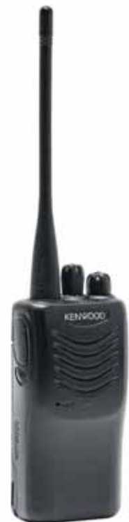
Dim: 54 x 113 x 24.9 mm

EN LA COMPRA DE ESTE RADIO ¡LLÉVESE GRATIS! Micrófono-Audifono de gancho TX-EHK