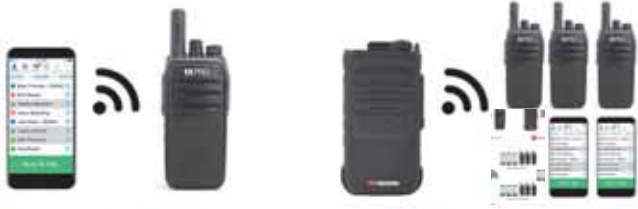
A Comunicación de 1 a 1