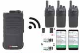
B Comunicación a Flotillas