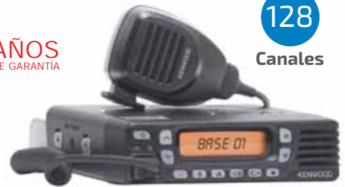
Dim: 160 x 43 x 137 mm