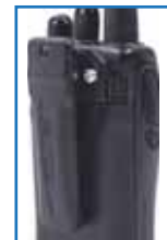
Nueva fijación de clip