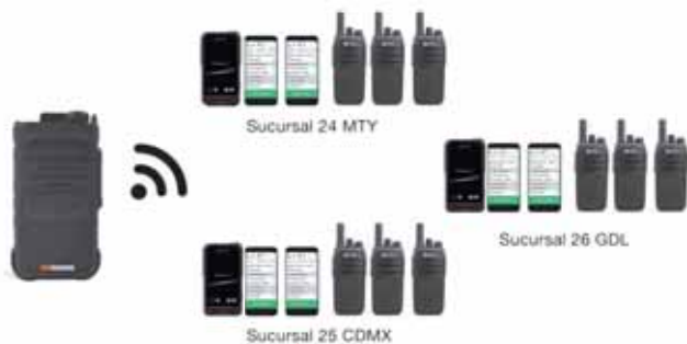
C Comunicación a Múltiples Flotillas